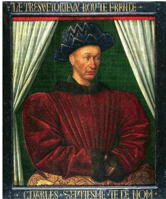
جان فوکید Jean Fouquet